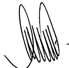
RODRIGO TAPIA AVELLO ALCALDE I. MUNICIPALIDAD DE QUILLECO